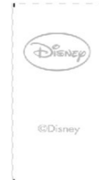
Etiqueta (imagem ilustrativa)

IMPORTANTE: Utilizar a etiqueta e a TAG conforme a licença trabalhada (Ex.: Princesas possui sua própria TAG e etiqueta, assim como: Carros 2, Disney Faires, etc)